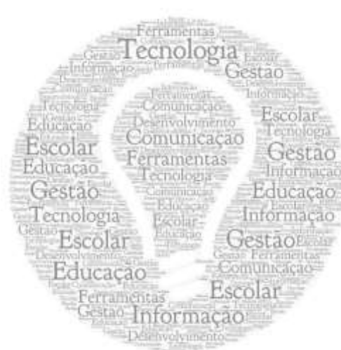
Figura 1 - Nuvem de Palavras

Através da Nuvem de Palavras - Figura 1, foi possível desenvolver as categorias a partir das palavras em evidência na nuvem de acordo com a análise de conteúdo de Bardin. Assim, foi elaborado a Tabela 1 com a frequência de