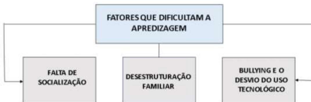
Figura 2: Fatores que dificultam a aprendizagem