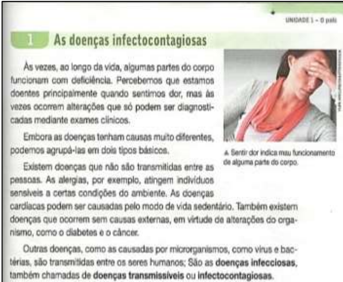
Figura 1- Recorte do livro - As doenças infectocontagiosas causadas por Microrganismos

Fonte: EJA Moderna - 8º Ano, 2013, pág. 253.